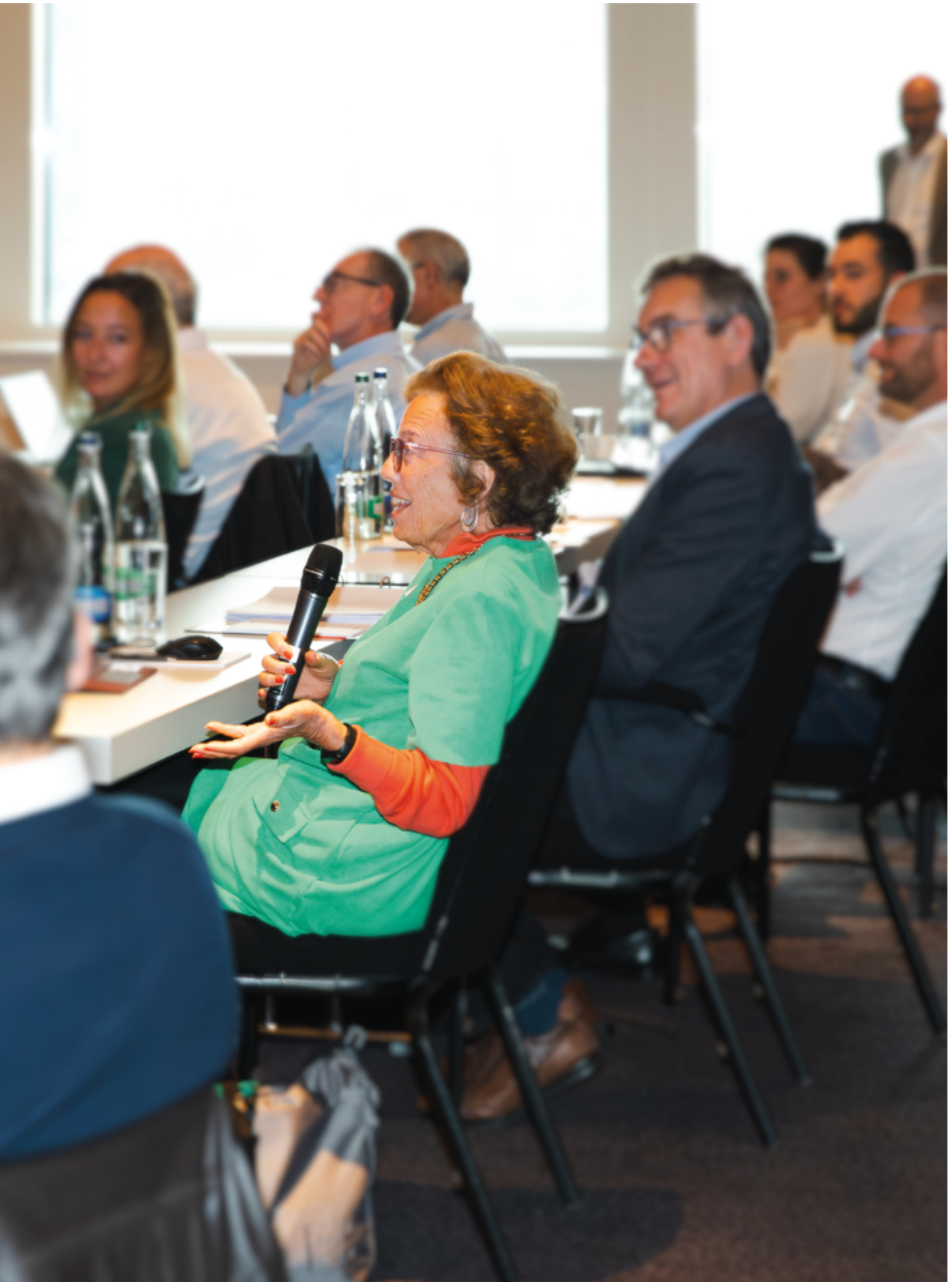
La conférence annuelle permet l'échange avec la communauté RPC.