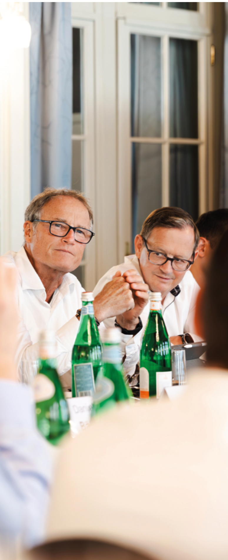
Le thème du développement durable suscite également de vives discussions au sein de la Commission d'experts; ici, lors de la séance du 21 juin 2023 à Berne.