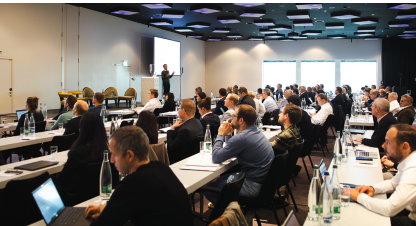
Plus de cent personnes ont participé à la conférence annuelle RPC du 16 novembre 2023 à l'hôtel Radisson Blu de l'aéroport de Zurich.

Jusqu'à la date d'approbation des comptes annuels, aucun événement significatif n'est survenu après la date de clôture du bilan.