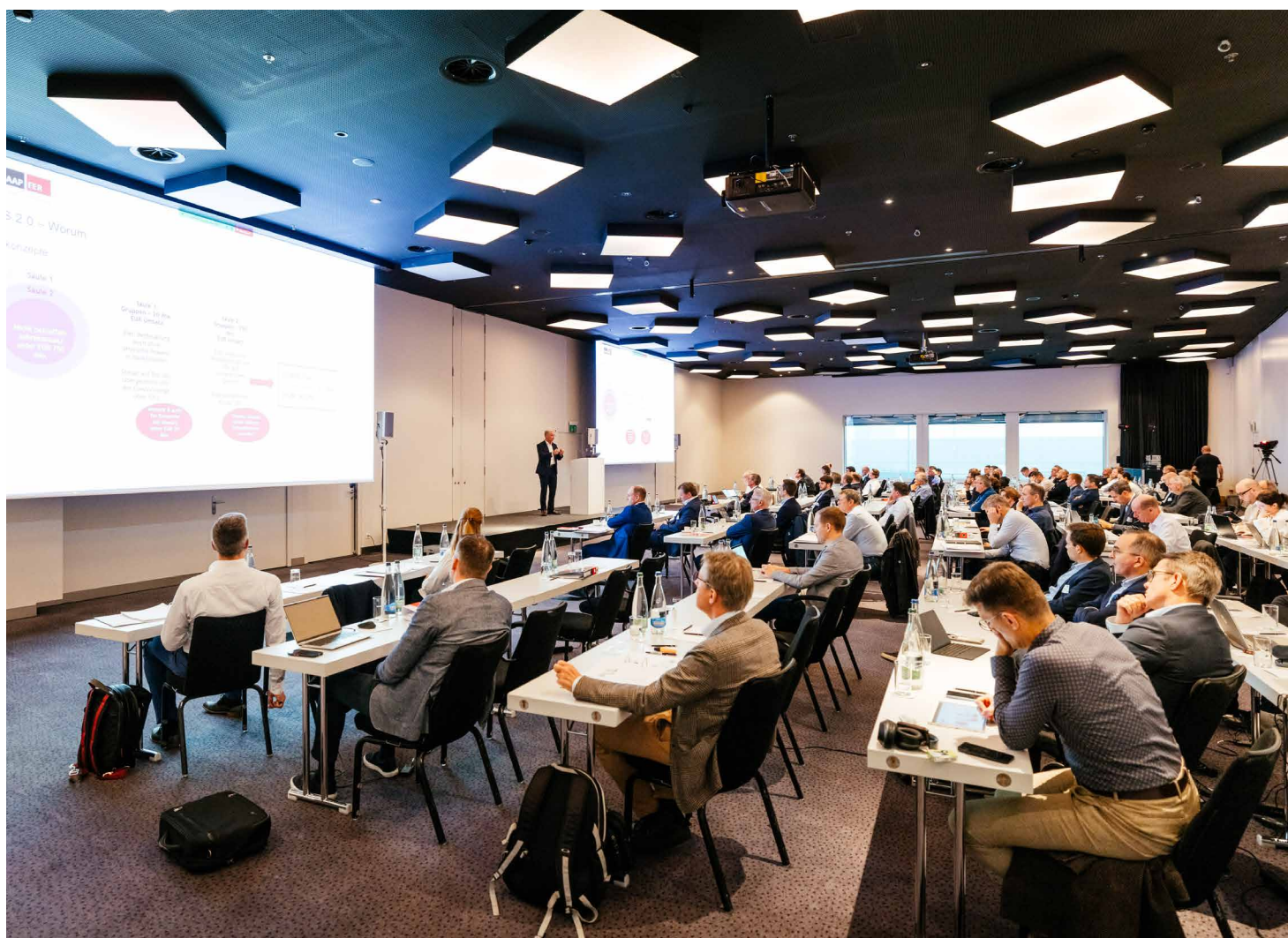
Le conseiller aux États Erich Ettl, l'un des orateurs de premier ordre lors de la conférence annuelle du 21 novembre 2024, explique les derniers développements quant à la réforme fiscale de l'OCDE.