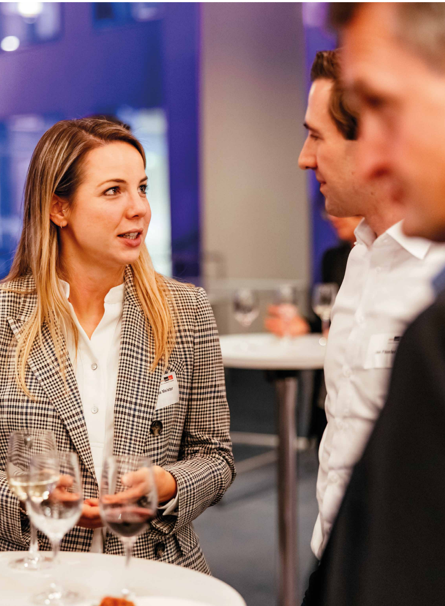
La conférence annuelle sert aussi aux échanges entre utilisateurs, réviseurs, investisseurs, autorités et scientifiques.